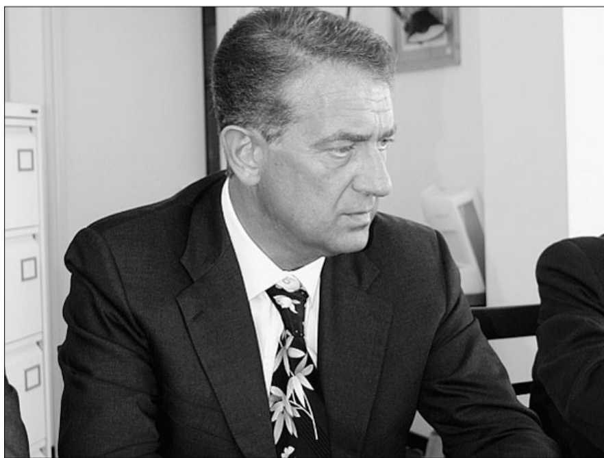
Gianmarco Marcucci segretario di Stato al Lavoro

"Nell'ambito della segreteria al Lavoro posso ricordare che è stata approvata la nuova legge sugli ammortizzatori sociali, fra l'altro approvata all'unanimità. Provvedimento che è entrato in vigore dal primo di questo mese. Lunedì (domani per chi legge, ndr) porterò in congresso le nuove norme sulla cooperazione sociale di servizio in favore delle persone svantaggiate che, riu-