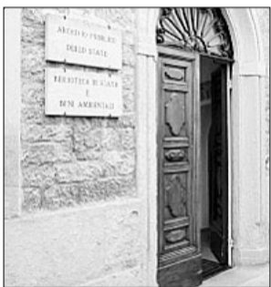
La Biblioteca di Stato

Da domani in Biblioteca Un corso per disegnare l'albero genealogico