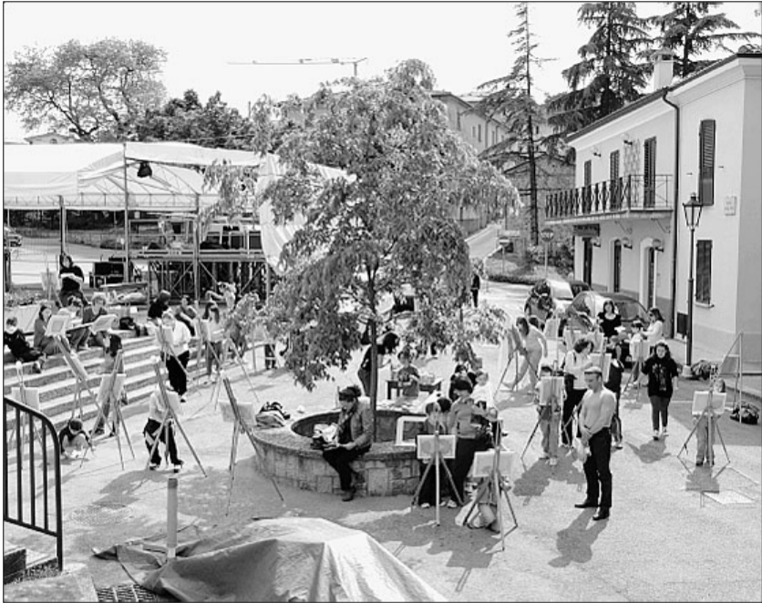
Un Castello per disegnare Ieri l'estemporanea di pittura con i bimbi della scuola elementare oggi la mostra degli elaborati nel centro storico